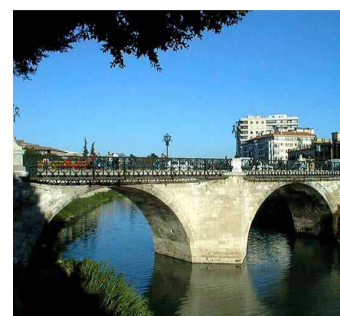
Brücke in Murcia