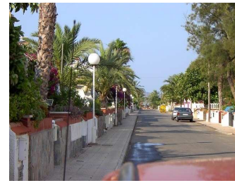
4 Minuten zum Strand

San Javier ist ein kleines schönes Städtchen mit Einkaufsmöglichkeiten für die Urlaubsküche.